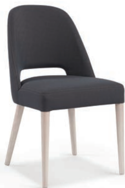
Gomo Lu Hole