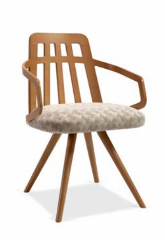
Nuzzle Liras cb