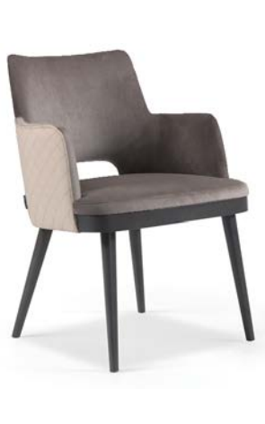
Kelly 04 Hole Maple