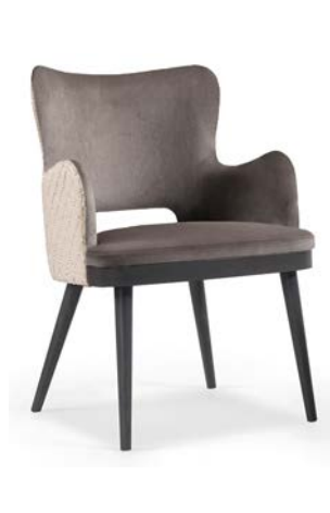
Kelly Flow 01 Hole Maple