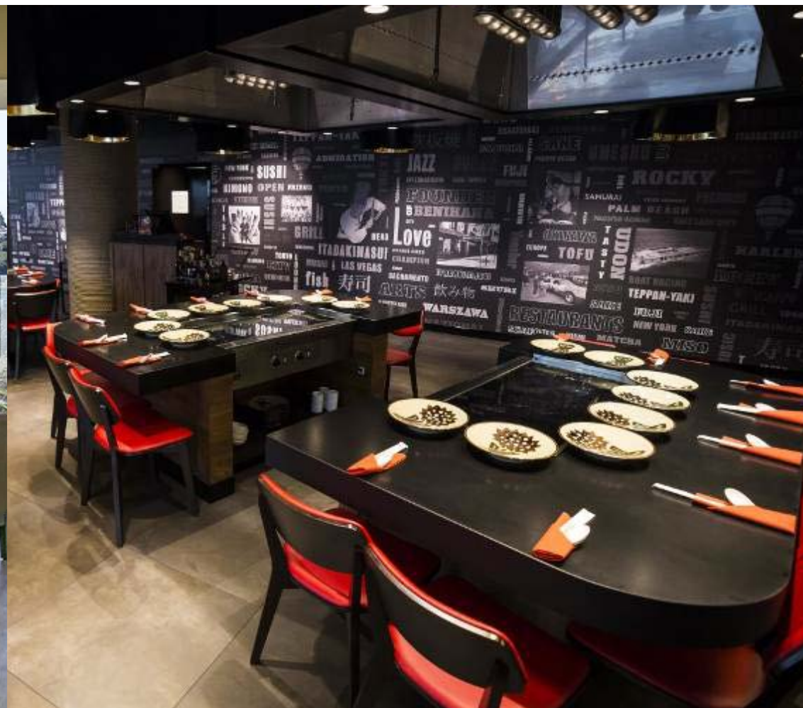
Benihana Sushi Restaurante Varsovia