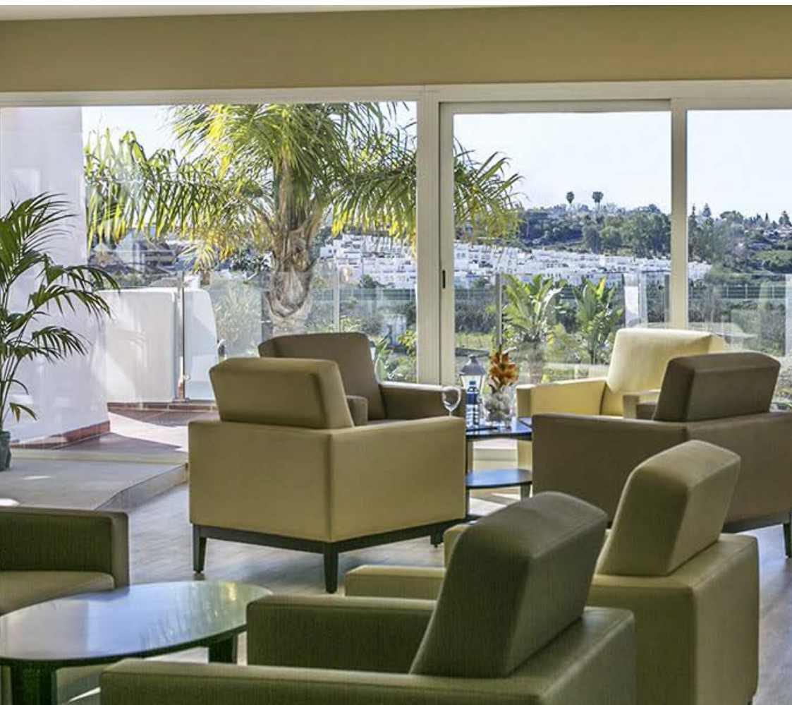
Aldea de la Quinta Hotel España