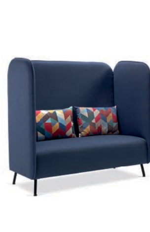
Bubble Banq cb