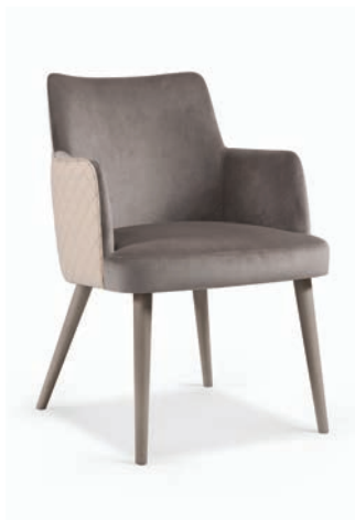
Kelly 01 Maple

una breve lista de nuestros productos más vendidos