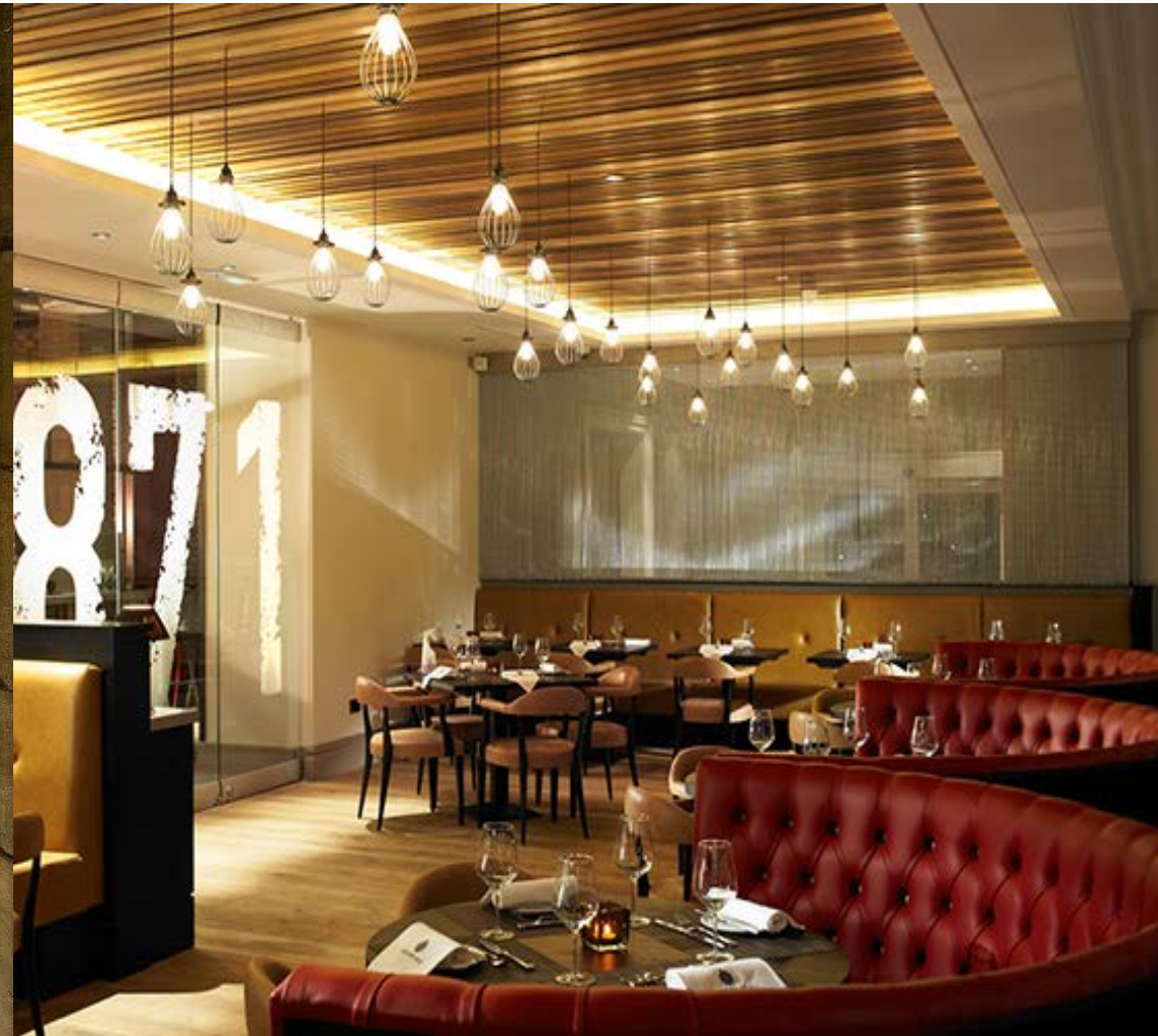
1971 bar UK