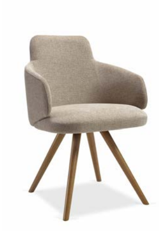
Nuzzle Total cb