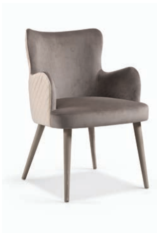
Kelly Flow 01 Maple