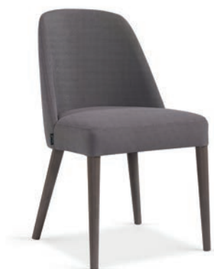
Gomo Lu Greyversion