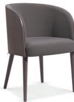
Gomo Maple Mad