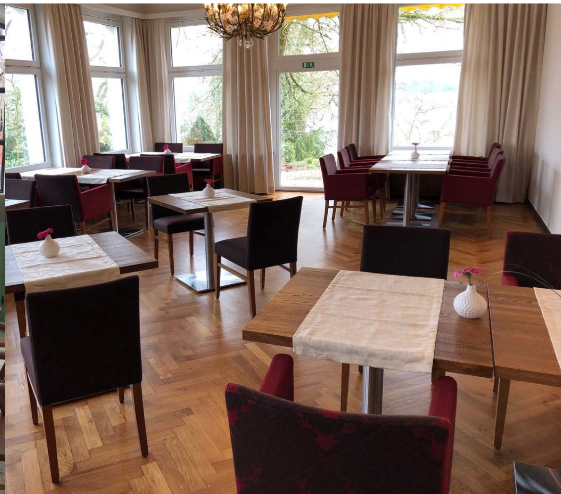
Hotel Delecke Alemania